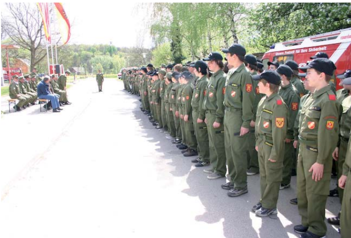
Wissenenstest in Lutzmannsburg: 227 Jugendliche des Bezirkes Oberpullendorf